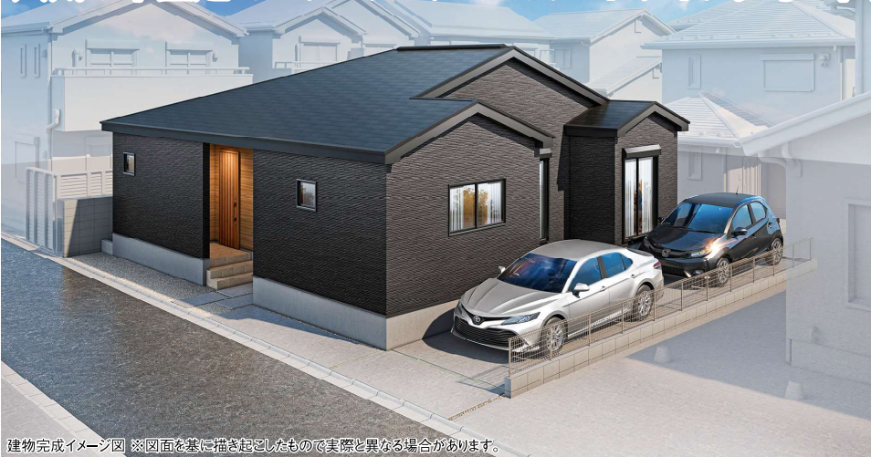
建物完成イメージ図 ※図面を基に描き起こしたもので実際と異なる場合があります。