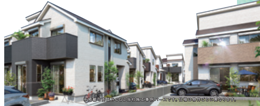
※掲載の街並みCGは当社施工事例ベースです。仕様は物件ごとに異なります。